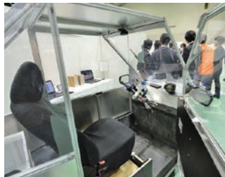
開発課題(超小型モビリティの開発)の展示