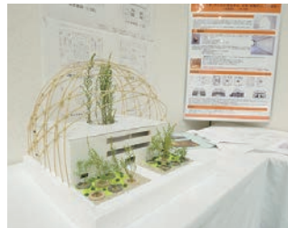
総合制作実習 住居環境科の作品展示