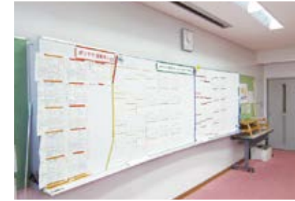
▲求人情報コーナー