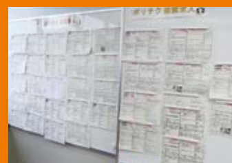
▲ポリテク依頼(専用)求人