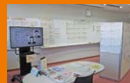
▲ビデオ視聴・求人情報コーナー