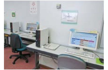
▲ハローワーク求人情報検索コーナー